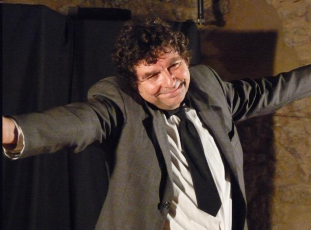
Quelques reflets de répétitions